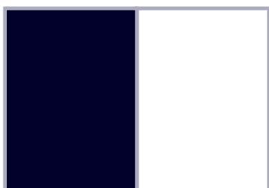
1 page 232 x 326 mm